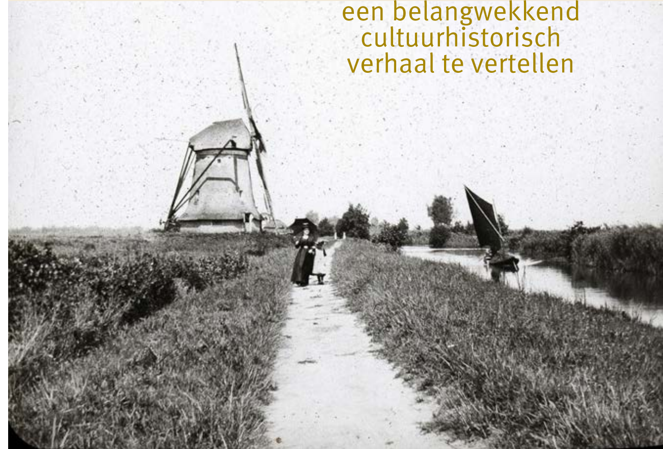
De molen rond 1900

In de zestiende eeuw werd in deze streek het verbouwen van boekweit populairder, vooral op minder voedzame grond deed dit gewas het goed. Het is daarom niet onwaarschijnlijk dat er toen in Giethoorn ook boekweit werd gemalen voor o.a. het typische Gieterse pannenkoekenmeel.