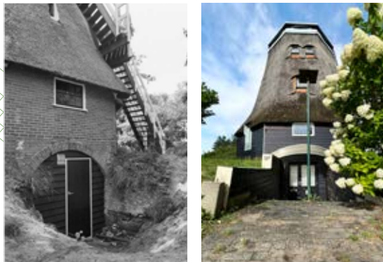
De 'grot' in ongeveer 1950 en nu

Wij verwachten dat de Gemeente Steenwijkerland in het laatste kwartaal van 2022 in staat is om het eigendom van de korenmolen aan de Stichting over te dragen. Daarna kan de Stichting starten met de fondsenwerving om de extra benodigde financiële middelen aan te trekken boven de reeds toegezegde subsidie van € 600.000. Zodra de toezeggingen voor de financiering van de restauratie en de bouw van het bijgebouw rond zijn, wordt een begin gemaakt met de aanbesteding van de bouw. Afhankelijk van de tijdsduur voor de bestemmingsplanwijziging hopen wij in het voorjaar van 2025 te starten met de restauratie.