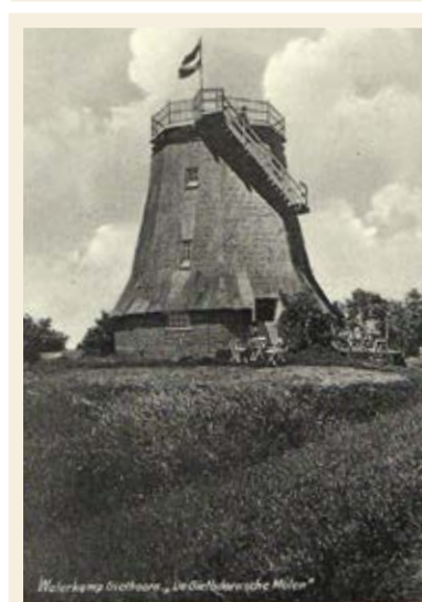
De molen als vakantieverblijf