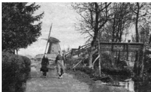
Molens bij Giethoorn, Willem Bastiaan Tholen (1882)