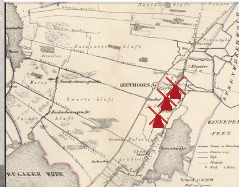
Molens aan de huidige Kerkweg (Kaart uit 1867)

In 1825 werd er, als gevolg van de watersnoodramp, besloten om het meer ‘De Giethoornse Wijde’ droog te malen. Er werd een poldermolen gebouwd aan de Molensloot in de nabijheid van het huidige Molengat. Aan de Kerkweg in de Middenbuurt werden ook twee poldermolens gebouwd. In 1879 kregen zij gezelschap van ‘molen H’, een voormalige poldermolen van de Zuidplaspolder bij Gouda, die voor 1100 gulden was aangekocht door molenaar Dirk Bos. In Giethoorn werd de molen als korenmolen opgebouwd en kreeg hij een invaargrot. Graan en meel konden hierdoor gemakkelijk met de punter worden aan- en afgevoerd. Aangezien bijna al het vervoer in Giethoorn over het water plaatsvond was deze grot noodzakelijk.